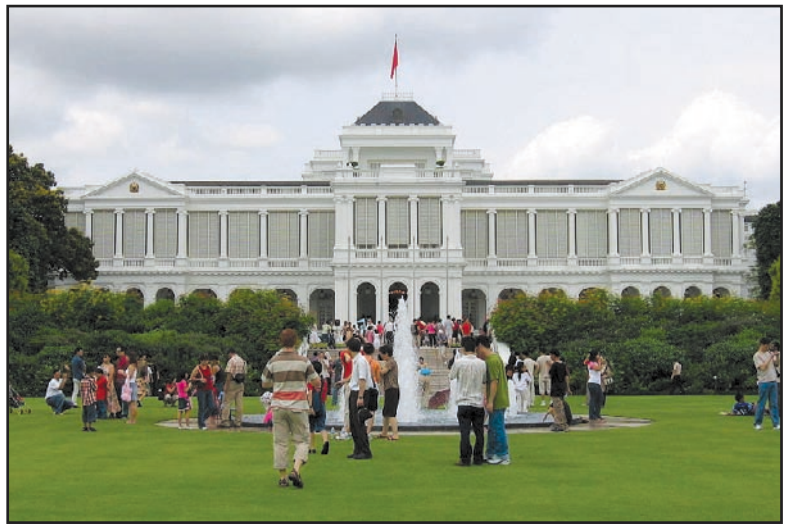
Sengkang, CC-BY-SA 3.0

ອີງກິດຍັງຄວບຄຸມມາເລເຊຍທີ່ຕິດກັບສິງກະໂປ. ມາເລເຊຍ ແລະ ສິງກະໂປເປັນເອກະລາດພ້ອມກັນ ໂດຍຖືກໂຮມເປັນປະເທດດຽວກັນໃນປີ 1963. ແຕ່ວ່າປະຊາຊົນສິງກະໂປ ແລະ ມາເລເຊຍມີວັດທະນະທຳ ແລະ ຊົນເຜົ່າບູຮານທີ່ແຕກຕ່າງກັນ, ພວກເຂົາຈຶ່ງຢູ່ຮ່ວມກັນບໍ່ໄດ້ດີບາດໃດ. ສອງປີຕໍ່ມາ ທຸກຄົນເຫັນດີວ່າ ພວກເຂົາຄວນຈະເປັນຄົນລະປະເທດ. ຕັ້ງ ແຕ່ນັ້ນມາເສດຖະກິດຂອງສິງກະໂປກໍ່ເຕີບໂຕຢ່າງໄວວາ ແລະ ໄດ້ກາຍ ເປັນສູນກາງອັນໃຫຍ່ໂຕຂອງການຜະລິດ ແລະ ການຄ້າຂາຍຂອງໂລກ.